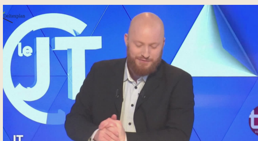
TV TOURS - UNIVERSITÉ LE SITE DES TANNEURS FAIT PEAU NEUVE

ASSURER PAR : CÉLINE BOUCHE & BENOÎT MARCHAND