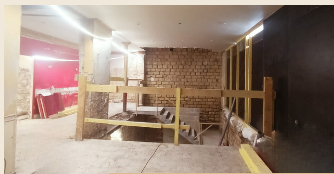
RDC Hammam Ivry-sur-Seine

ASSURÉ PAR : FARID LAMANI & GHANI SADCHAOUCHE