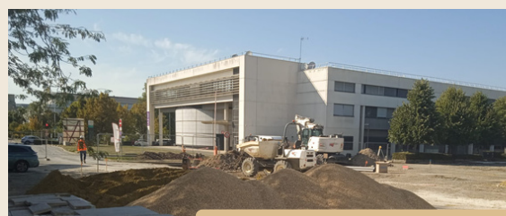
EPU de TOURS