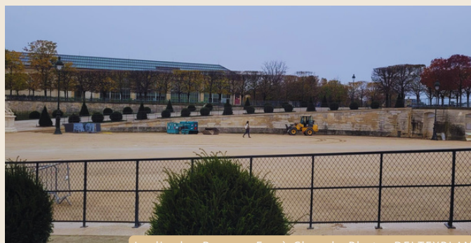
Jardin des Rampes Fer-à-Cheval