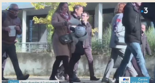
FRANCE 3 - TOURS GROS CHANTIER À L'UNIVERSITÉ

Ces vidéos sont disponibles sur la pages actualité article "EPU De TOURS"