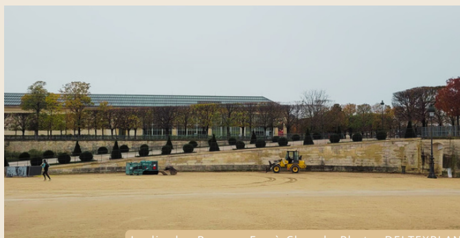
Jardin des Rampes Fer-à-Cheval