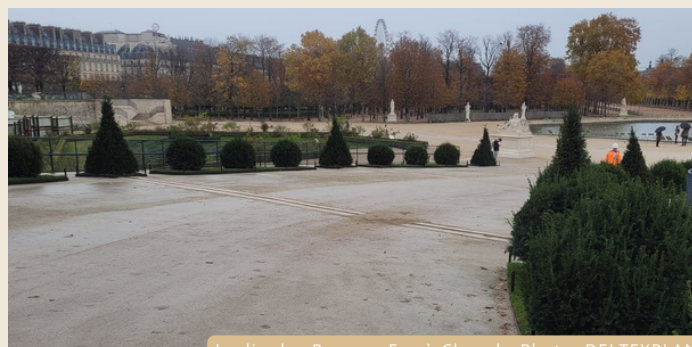
Jardin des Rampes Fer-à-Cheval