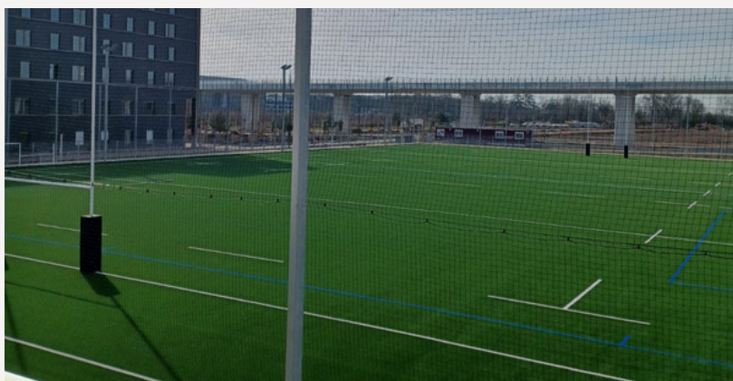
Complexe sportif universitaire terrien extérieur