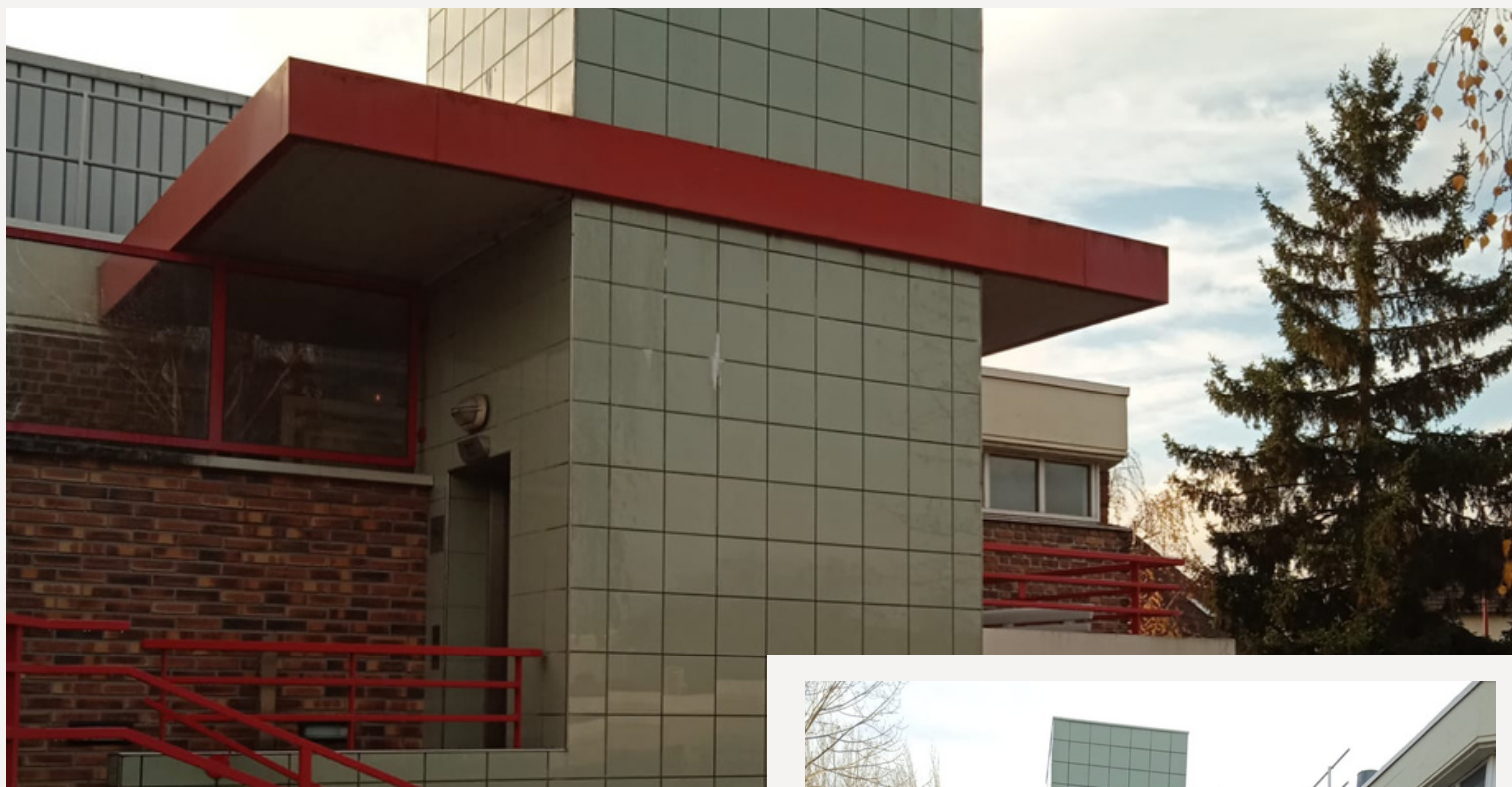
MJC – Louise Michel extérieur à FRESNES