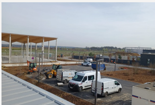
Complexe sportif universitaire extérieur