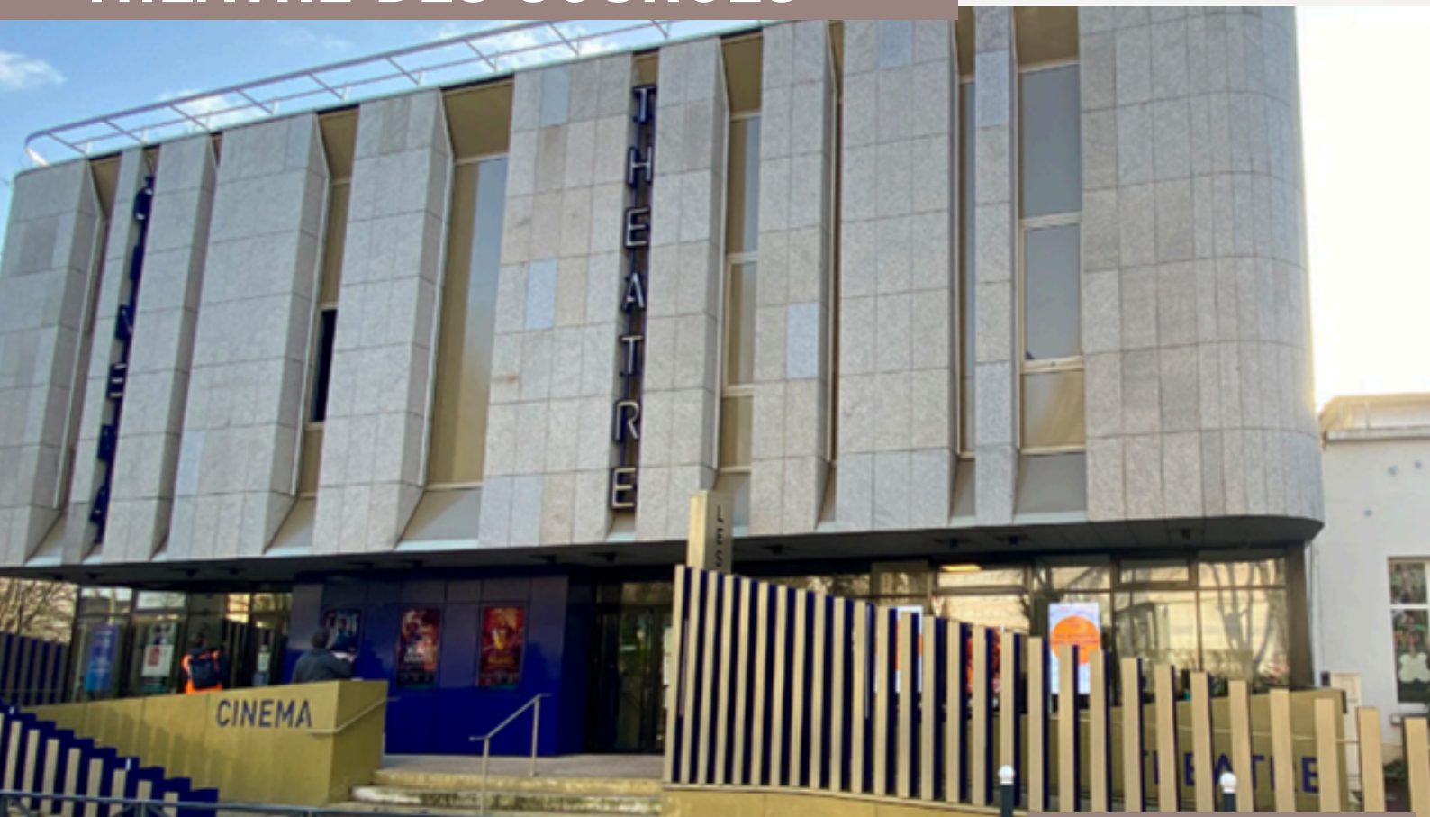
Théâtre des Sources à Fontenay-aux-Roses

DELTEXPLAN intervient en tant que Maître d'œuvre dans le cadre d'un projet de réhabilitation intérieure du théâtre qui implique la mise aux normes d'accessibilité pour les personnes à mobilité réduite, l'amélioration des performances énergétiques, la conformité de l'espace bureau attenant au foyer,