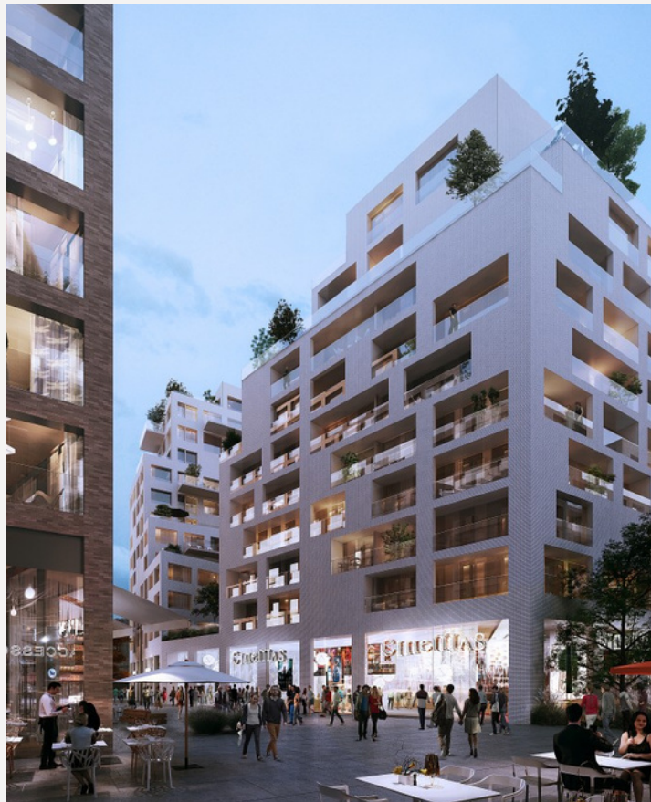
Cœur de Ville Bobigny