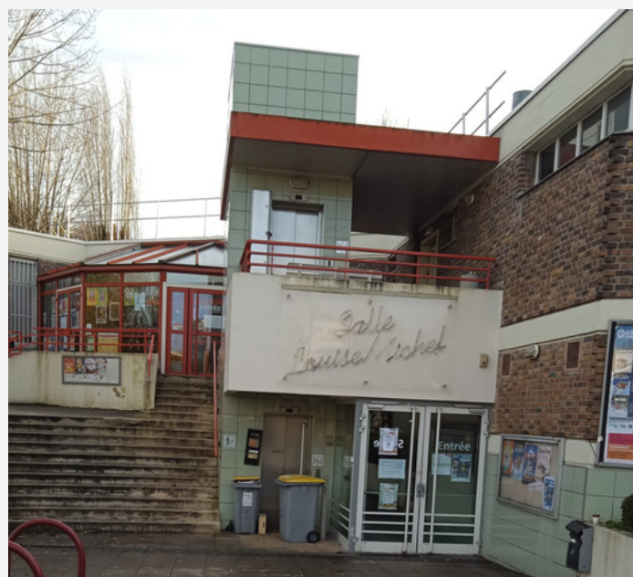
MJC – Louise Michel extérieur à FRESNES

Notre rôle en tant qu'OPC, est essentiel dans le bon déroulement du projet de remplacement de l'ascenseur extérieur de la MJC. Nous veillons à la planification minutieuse de toutes les étapes, à la coordination des différents intervenants et à la supervision du chantier dans son ensemble. Grâce à notre expertise et notre engagement, nous garantissons la réussite de ce projet important pour la communauté de la MJC.