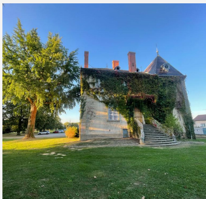
Château Bouthier-Cornaz

DELTEXPLAN intervient en tant qu'OPC dans le cadre des travaux de restructuration du château Bouthier-Cornaz en centre culturel et de la création d'une extension. DELTEXPLAN est fier de participer à la rénovation de ce site historique de la ville de Chaponnay.