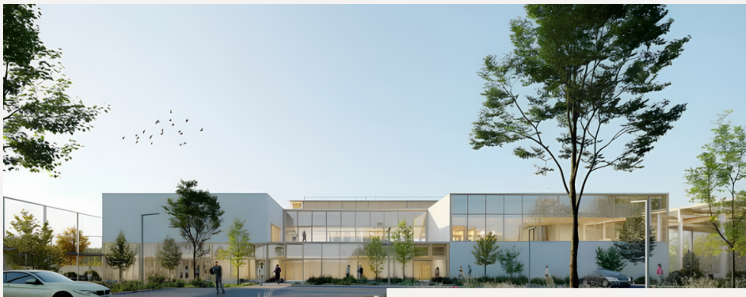
Complexe sportif universitaire de Corbeville