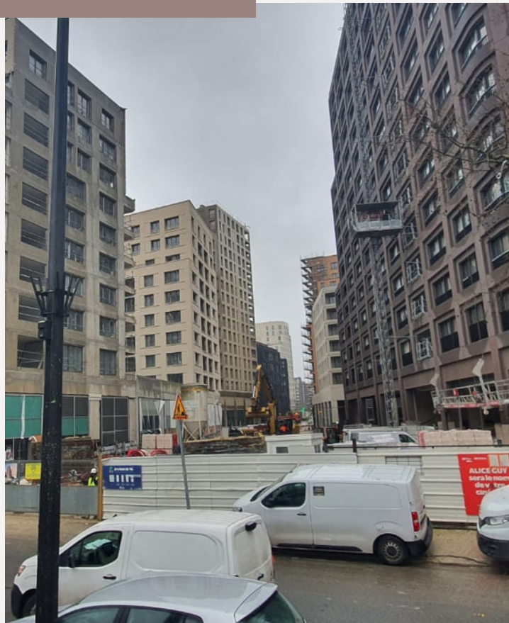
Cinéma de Bobigny