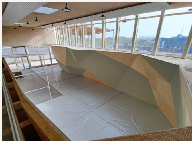
Complexe sportif universitaire Salle d'escalade