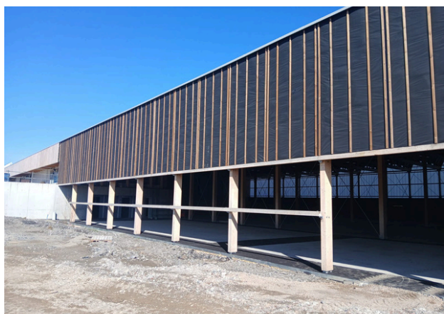
Façade gymnase complexe sportif Reignier-Esery

Les panneaux solaires du Lot 15 seront livrés et installés le 15/04. L'ascenseur Kone est en cours d'installation et se prépare pour la mise en service. Lot 13 , l'installation des pendillons a été achevée le 10/03, et les ajustements des trappes ont été terminés le 17/03. Le 3/03, une intervention a eu lieu sur la façade Nord du gymnase, et les enrobés ont été finis le 10/03. Les réparations des façades Nord et Est sont en cours pour le Lot 03c . pour le Lot 05 , l'installation des coins des garde-corps est terminée. Dans le Lot 07 , les impressions et la pose des ossatures dans les locaux humides ont commencé et le nettoyage est achevé.